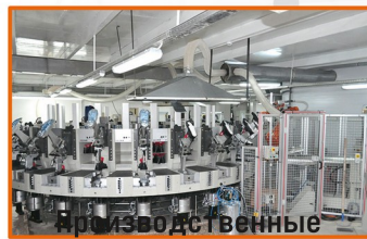
Производственные цеха и помещения