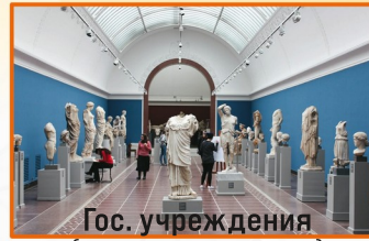
Гос. учреждения (театры, музеи и т.д.)